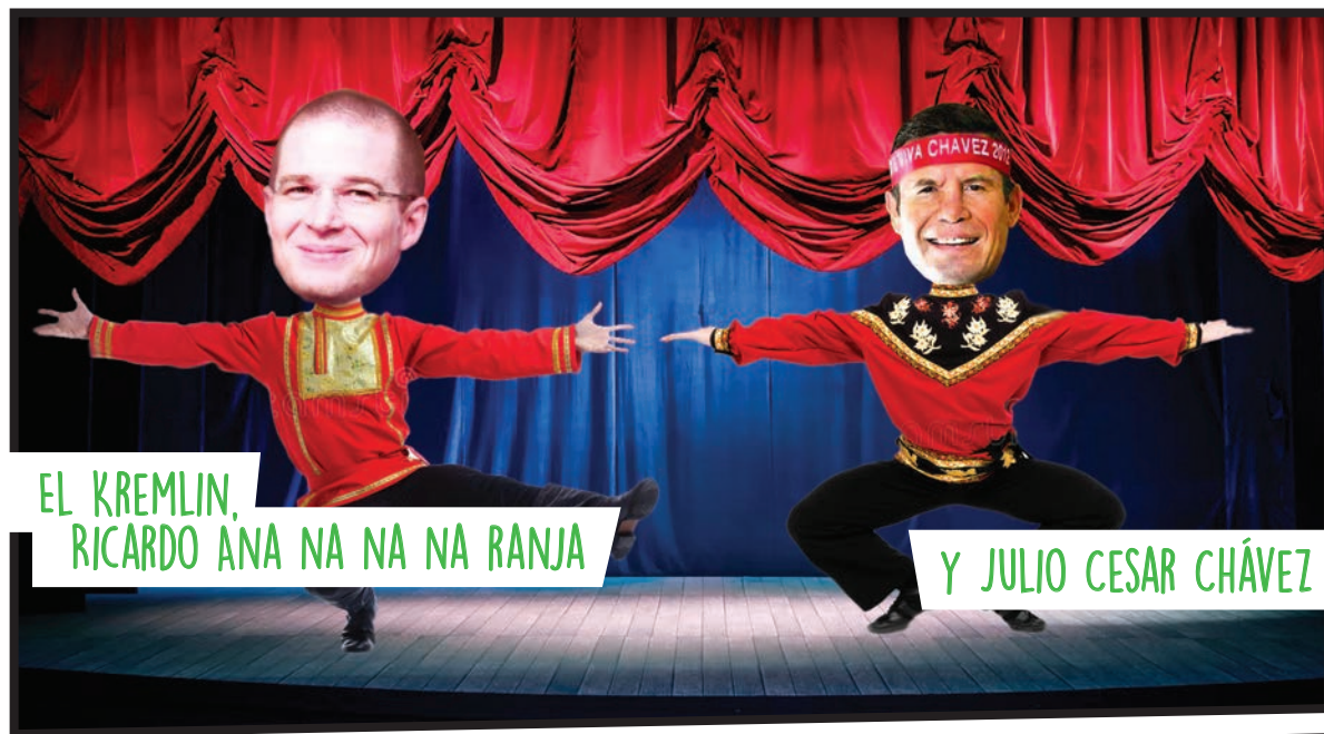
EL KREMLIN, RICARDO ANA NA NA NA RANJA