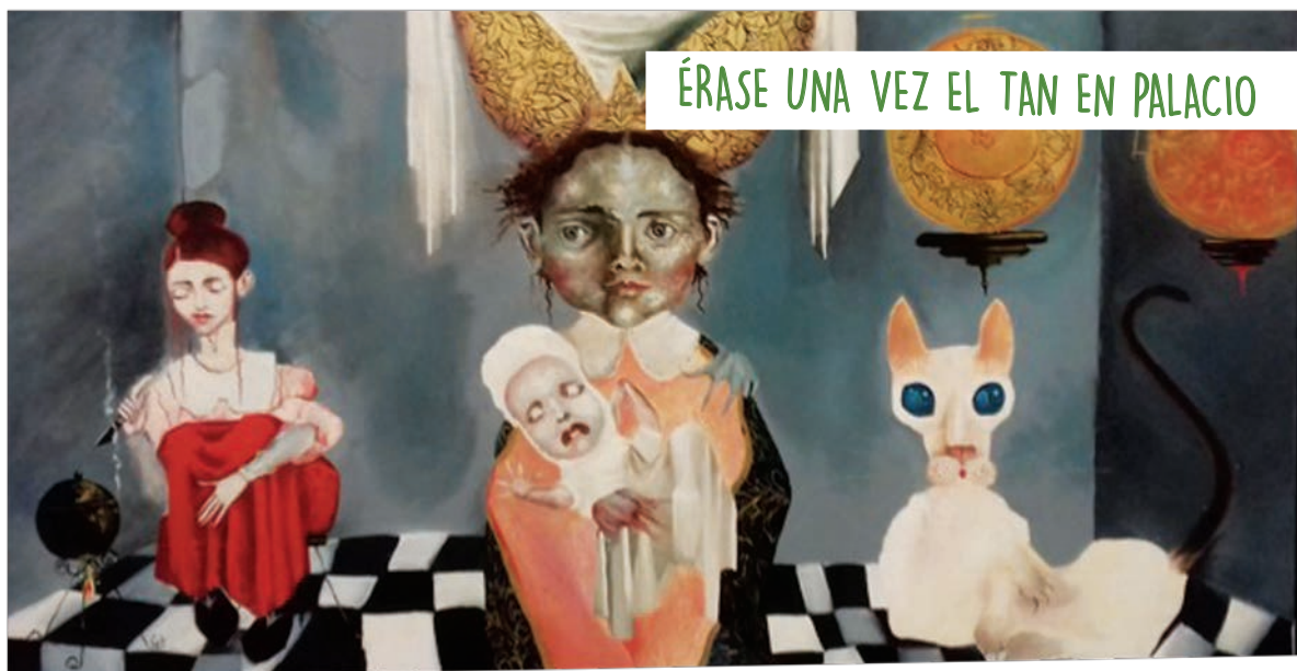
ÉRASE UNA VEZ EL TAN EN PALACIO

Visité a Jerónimo en el país de las maravillas y lo encontré acompañado por San Antonio y por demonios de este mundo y de otros mundos, tiempos, e imaginarios. Con él estaban también seres fantásticos de esta vida y de otras vidas, geografías, universos y fábulas. Pero en realidad, no era a Jerónimo a quien buscaba, sino al Tan. Pero fue Jheronimus van Aken, el Bosco, quien apareció suspendido en la puerta del recinto del palacio de cantera que guarda los relatos e historias más increíbles y terribles que pueden existir en la mente humana. Impávido como el guardián del ingreso a un país mágico, deja pasar al caminante ingenuo sin advertirle que al cruzar el umbral, se encontrará con tantos territorios, comarcas, reinos, suelos y cielos como los que alcance a recrear con la mirada. Así es el lugar donde habitan las maravillas, las quimeras, los misterios y la nigromancia de los mundos del Tan.