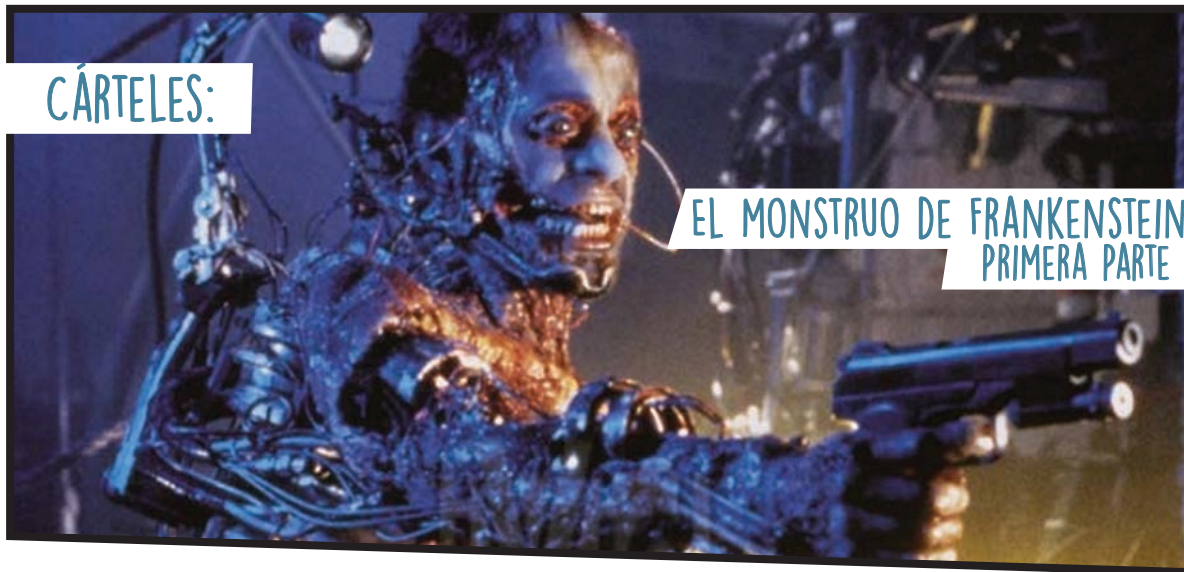
EL MONSTRUO DE FRANKENSTEIN PRIMERA PARTE

Para no volverse loco ante el monstruo de Frankenstein que levanta, tortura y asesina a jóvenes estudiantes para después disolver sus cuerpos en ácido, es necesario revisar la historia del narcotráfico en México en los últimos 50 años.